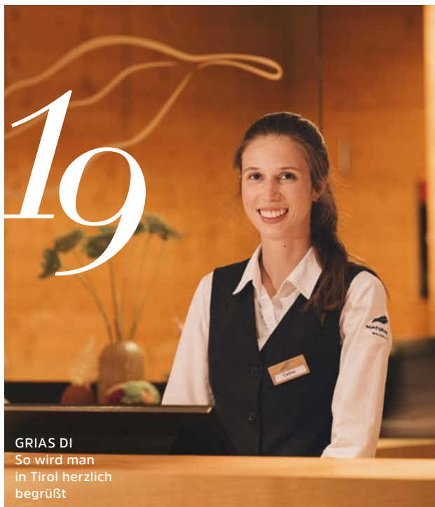
GRIAS DI So wird man in Tirol herzlich begrüßt