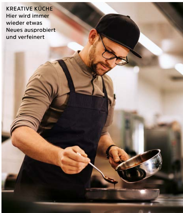
KREATIVE KÜCHE Hier wird immer wieder etwas Neues ausprobiert und verfeinert