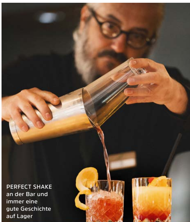
PERFECT SHAKE an der Bar und immer eine gute Geschichte auf Lager