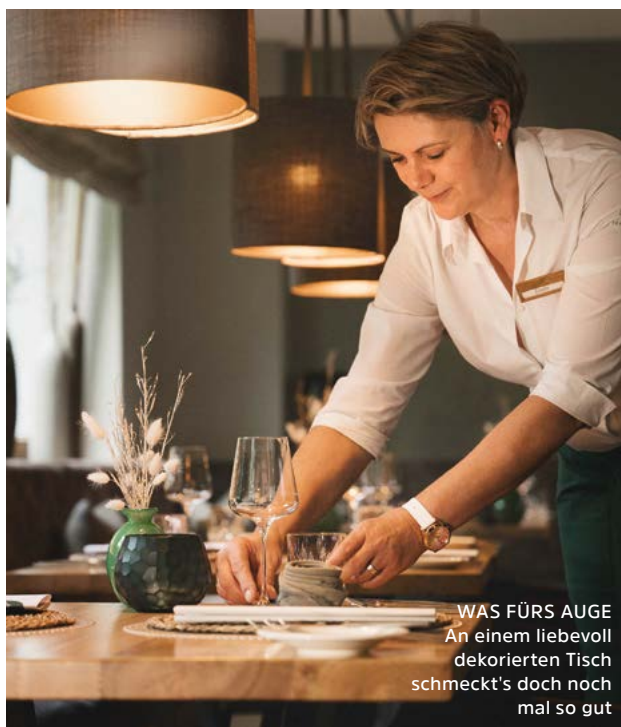
WAS FÜRS AUGE An einem liebevoll dekorierten Tisch schmeckt's doch noch mal so gut